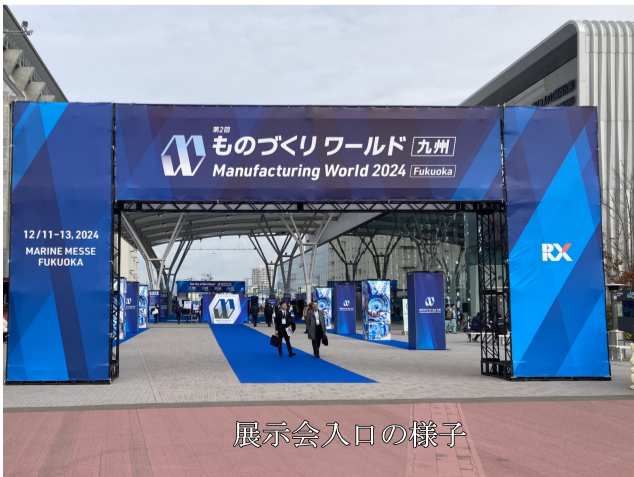
展示会入口の様子