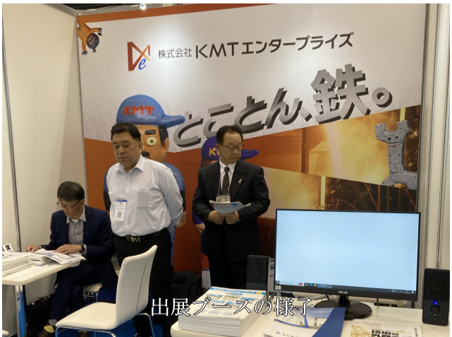
出展ブースの様子

当会では、第2期計画（令和4年～令和8年）の認定を経済産業大臣より受けました。年間を通して、経営発達支援計画に基づいた小規模事業者の売上拡大、販路拡大、生産性向上を支援するための事業を実施しています。経営発達支援計画は、春野商工会公式HPに掲載されています。支援を希望される事業者様は春野商工会までご連絡ください。事業遂行にあたりましては、皆様のご協力を宜しくお願いいたします。