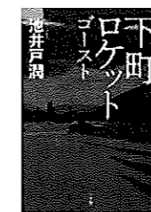
池井戸潤/著、小学館/刊