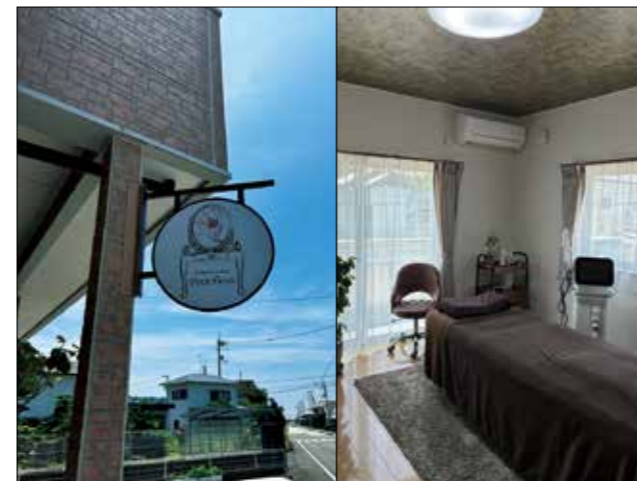
新店舗看板(左)と脱毛器を導入したサロン施術室(右)