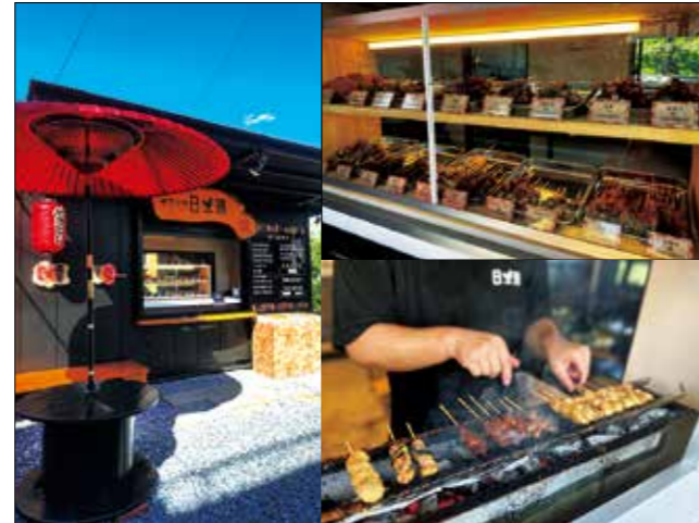
店舗(左) 商品陳列(右上) 焼き行程(右下)