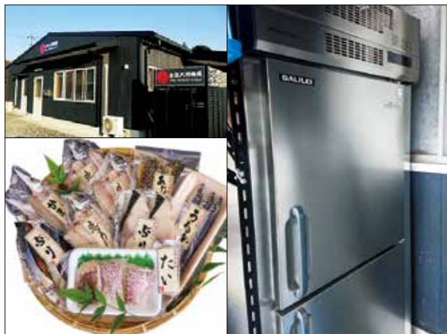
店舗外観(左上)、取扱商品(左下)、急速凍結庫(右)