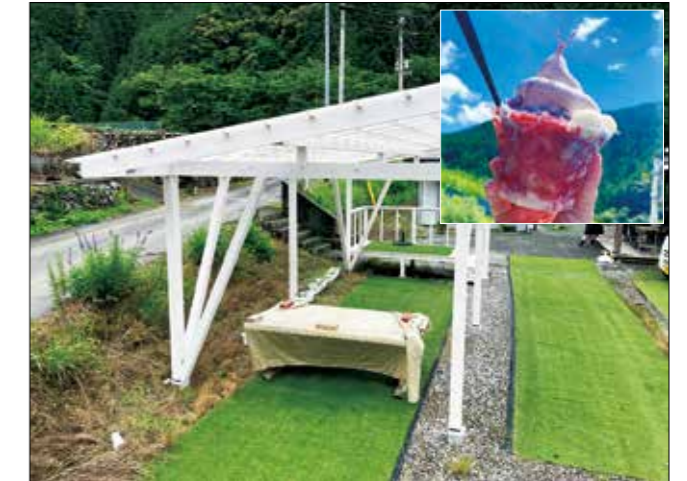
新設した飲食スペース