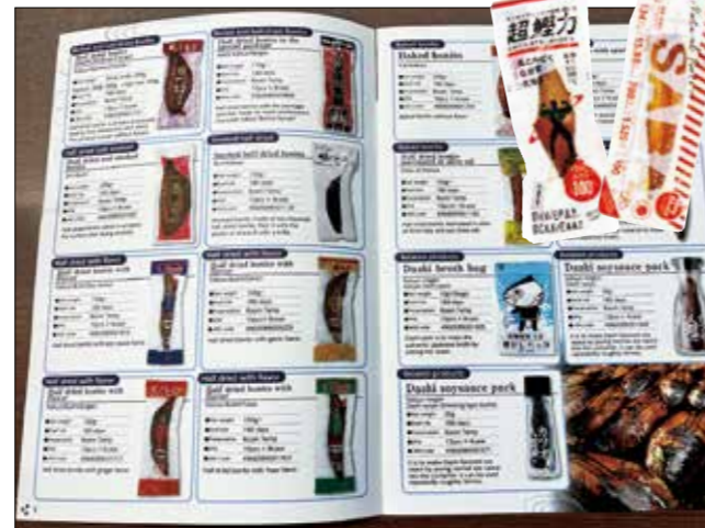
英語バージョンの新パンフレット(左)と取扱商品(右)