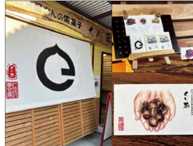
くり蔵暖簾(左)、パンフレット・ショップカード(右上下)