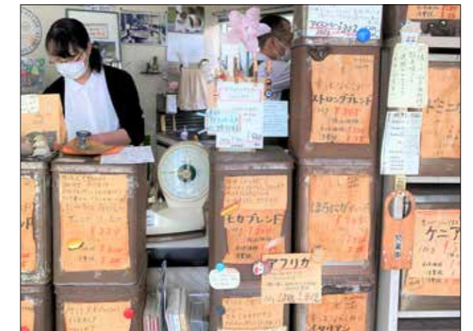
種類が豊富で鮮度もよい豆が並ぶ老舗珈琲店