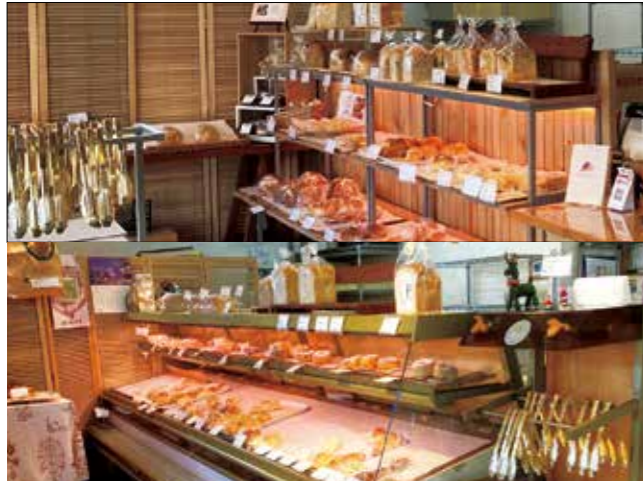
店内改装後(上) 店内改装前(下)